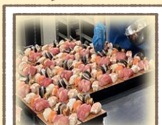
お寿司の盛り付け

【敬老の日】★握り寿司、茶わん蒸し、あおさの味噌汁★ 敬老の日はお寿司でお祝いです。皆さんお寿司は大好きで、いつもリクエスト上位です。だしから手作りの特製茶わん蒸しも一緒に。